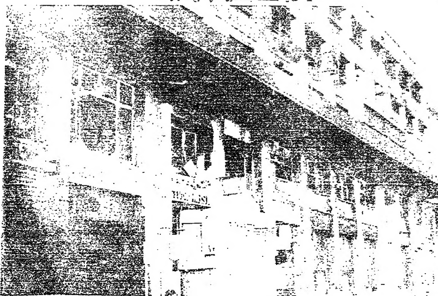
■ من امان الحرائق والشماع